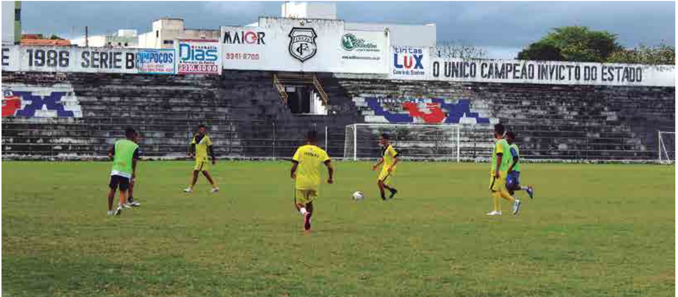
Sem a conquista de um título desde 2011, o Treze projeta um 2019 de sucesso, após ter conseguido o acesso para a Série C do Campeonato Brasileiro, e comemora a passagem do aniversário de 93 anos em grande estilo