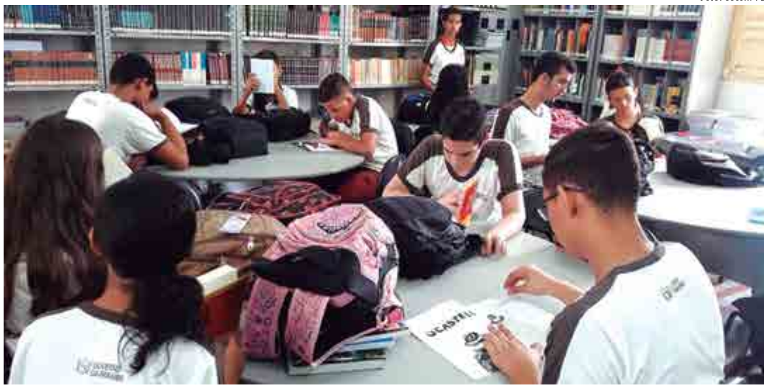
Recursos pedagógicos estão sendo implementados por professores da Rede Estadual de Ensino para motivar os educandos na leitura e produção textual

Ao término de cada bimestre os alunos são incentivados a apresentar o conto em outra linguagem artística, eles transformam a literatura em fotografias, vídeos poemas e documentários