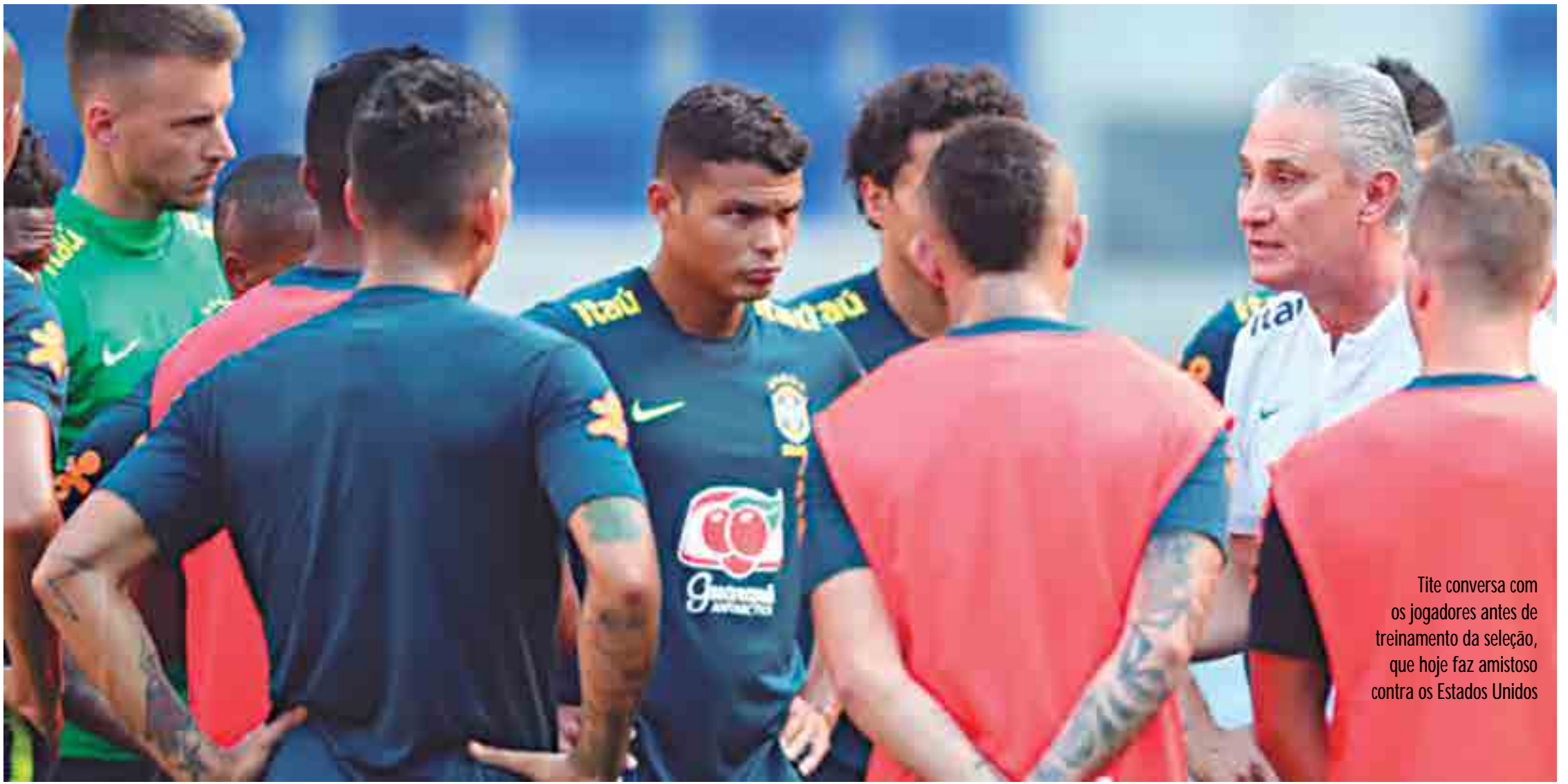
Tite conversa com os jogadores antes de treinamento da seleção, que hoje faz amistoso contra os Estados Unidos