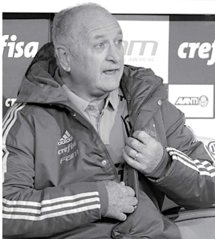
Felipão não vê motivo para comemoração e pensa agora no Corinthians