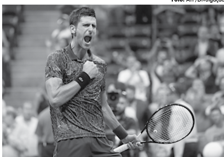
O sérvio tem uma grande vantagem sobre o japonês nos confrontos

Nas semifinais, Djokovic vai encarar o japonês Kei Nishikori, número 21 do mundo. A outra semifinal terá o espanhol e líder do ranking Rafael Nadal dian-