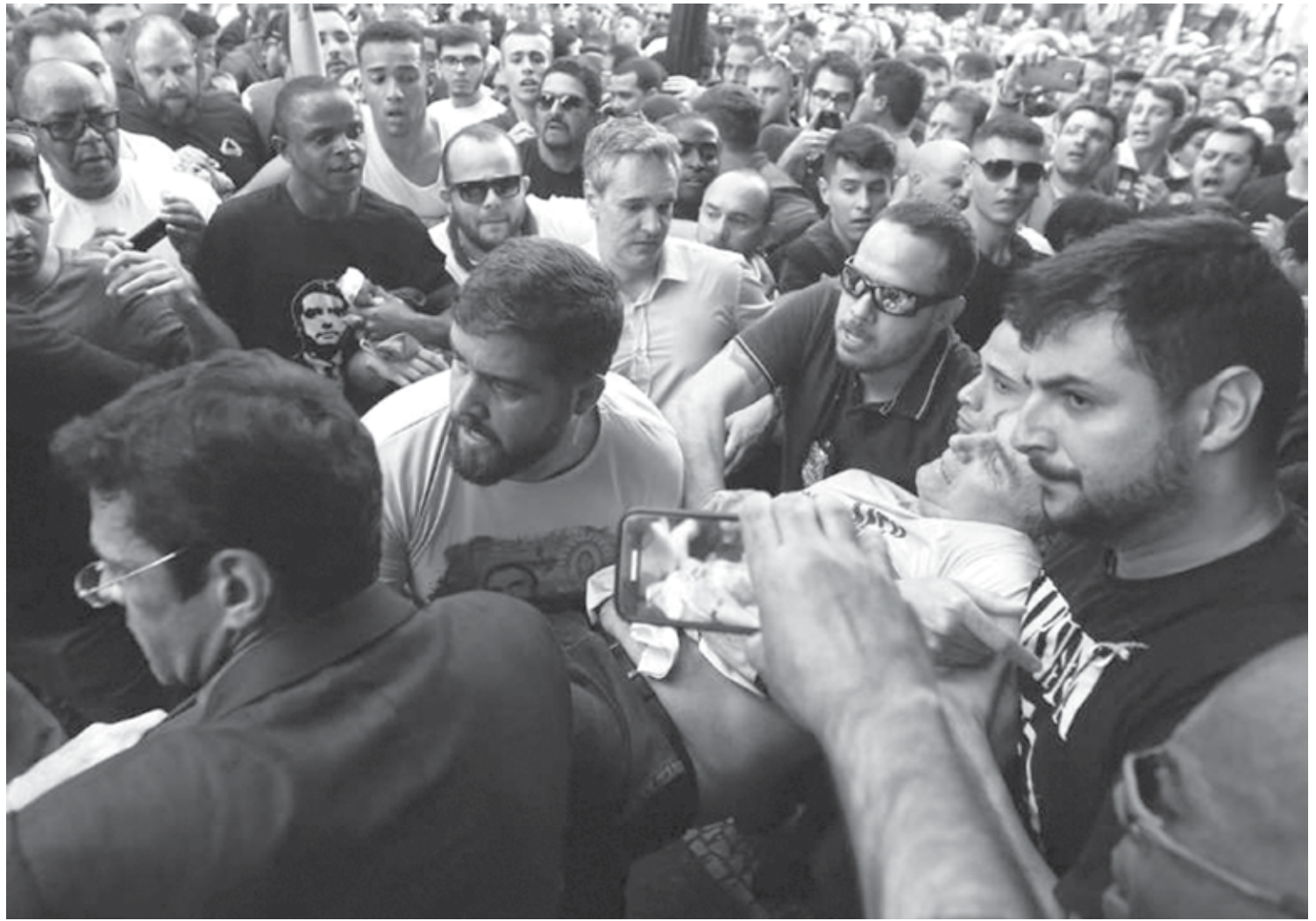
O candidato Jair Bolsonaro era carregado pelas ruas da cidade mineira de Juiz de Fora por seus apoiadores, quando recebeu uma facada no abdômen

O deputado foi atendido na área de urgência, passou por um exame de ultrassom e foi levado ao centro cirúrgico. A informação de seu estado de saúde foi passada por uma fonte da campanha de Bolsonaro, segundo a qual ele reagiu bem ao procedimento e deve se recuperar sem grandes complicações.