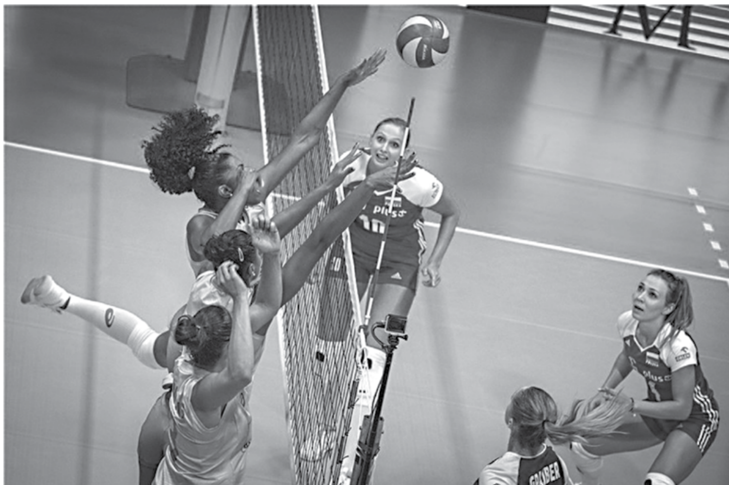
Seleção perdeu para a Polônia na última quarta-feira pelo placar de 3 sets a 2 e hoje tenta a segunda vitória diante da equipe russa na Suíça